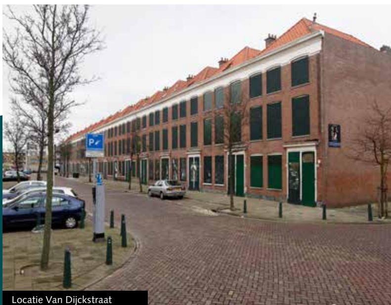
Locatie Van Dijkstraat