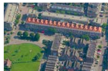
Van Dijkstraat vanuit de lucht

In de Van Dijkstraat zijn flexibele kavels te koop. Gelegen aan het groene Teniersplantsoen met zijn kinderboerderij en volkstuintjes. Een bruisend stukje Den Haag midden tussen de monumentale Van Ostadehofjes, Om en Bij en rijksmonument 'Bastion Le Roi'. U vindt er veel ambachtelijke winkeltjes met producten uit de hele wereld. Avenue Culinair aan de gracht, met haar vele restaurantjes en gezellige cafés, ligt op loopafstand. Het zwembad met sauna en Hammam en Theater De Vaillant liggen op steenworpafstand. Net als de binnenstad van Den Haag, de Haagse Markt en station Hollands Spoor. De Bijenkorf en Hema zijn slechts vijf minuten fietsen. De buurt heeft goede scholen, vele supermarkten, speeltuinen en sportvelden als het Johan Cruijff Court. Parkeren vindt plaats op de openbare weg. Geen auto? Spring dan met hetzelfde gemak in de tram of bus om de hoek. Wat heeft deze locatie niet? Uw eigen droomhuis!