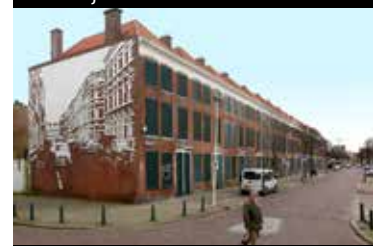
Locatie Van Dijkstraat