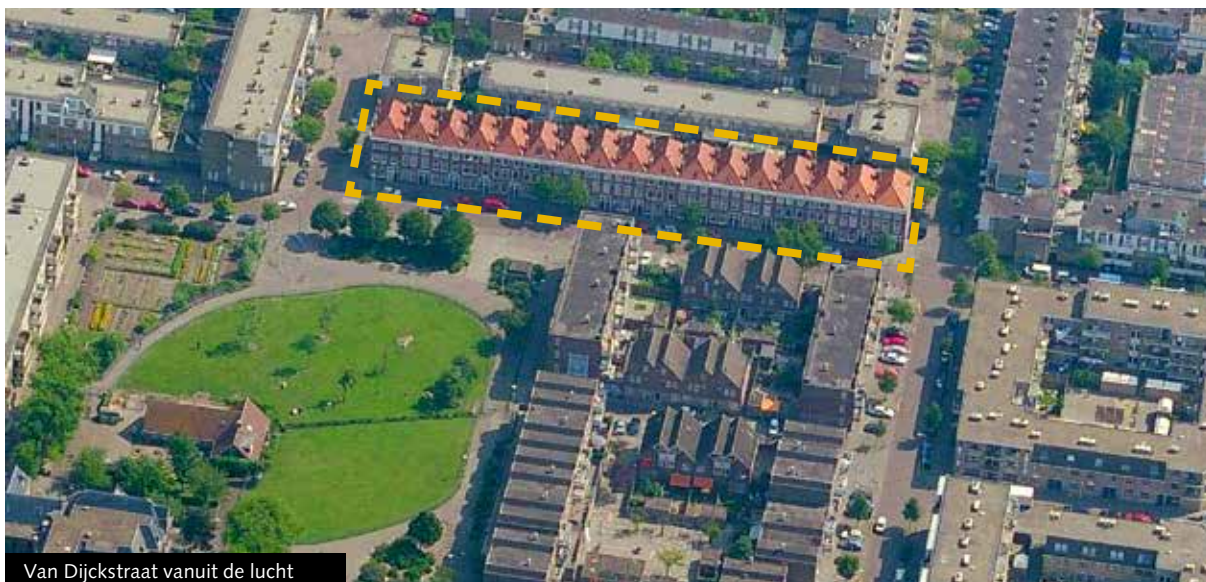
Van Dijkstraat vanuit de lucht

Woningstichting Haag Wonen is rechthebbende van de locatie Van Dijkstraat. De gemeente Den Haag verzorgt namens Haag Wonen de verkoop van de kavels.