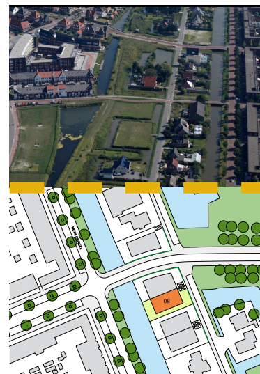
Afmetingen van kavelpaspoort in meters.