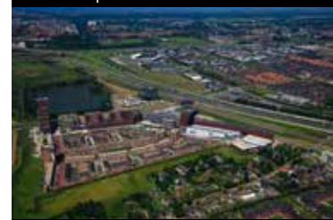
Fregatsingel vanuit de lucht