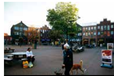
Nootdorp - De Parade

De Fregatsingel behoort tot de groene rand van dijken en tussenboezems die om de Ypenburgse deelwijk De Caaïen ligt. Een deel ervan wordt bebouwd. Het nieuwe woonwijkje ligt tussen de singel en een dijkje. Twee bruggen ontsluiten de buurt. Ruime kavels met uiteenlopende vormen die inspireren tot bijzondere woningontwerpen. Een auto-luwe wijk, rustig, landelijk, vrij én hoogwaardig. Eén stap buiten de deur begint de polder. Wandelen, spelen en ontdekken, water, riet en weide. Fruitbomen en dijken bezaaid met kruiden. Ook dichtbij: de vele faciliteiten en mogelijkheden van de 'grote' stad. Scholen, zoals de British School, winkel- en gezondheidscentra en sportvoorzieningen. Het Hofbad - het enige overdekte 50-meter wedstrijdabad in de regio - is om de hoek. De automobilist rijdt vanuit Ypenburg gemakkelijk de A4, de A12 en de A13 op. NS-station Den Haag Ypenburg is op loopafstand en Randstadrail 3 brengt u naar onder andere Den Haag Centrum.