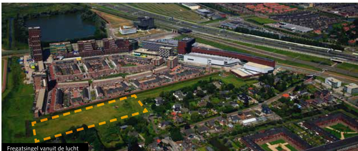
Fregatsingel vanuit de lucht